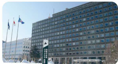
北海道水産林務部 林務局林業木材課利用推進係 問合せ先 TEL.011-204-5492

道庁の玄関ホール及びエレベーターホールを、道産木材(HOKKAIDO WOOD)を利用した「北海道らしさ」を感じることでできる木質空間に。