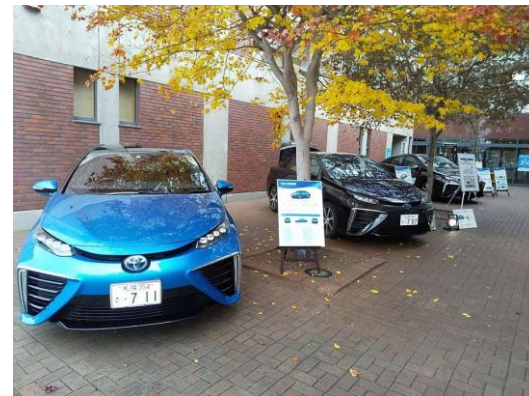
留萌新公共・鹿追町イベントでのFCV展示