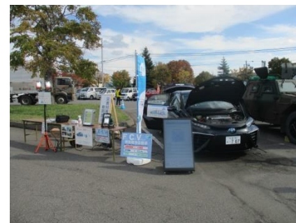
防災訓練で照明等をFCVから給電