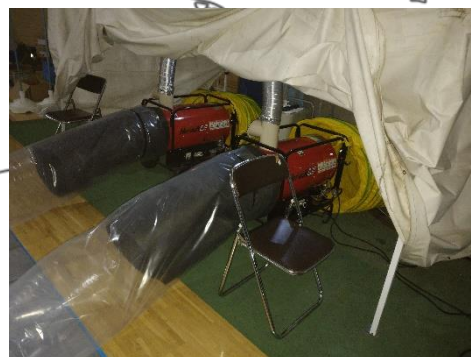
停電時を想定した避難所運営訓練 (FCVからジェットヒーターに給電)