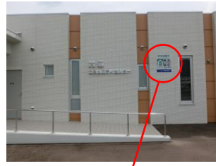
【避難所標識の整備】