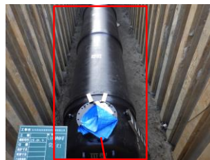
【耐震性貯水槽の整備】