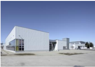
【防災センターの整備】