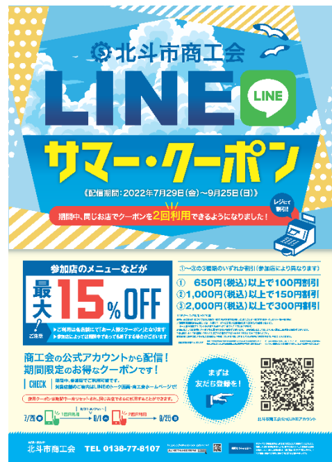
〔事業促進用ポスター〕

第3回となる令和4年(2022年)度は、道の「地域事業者連携型販売促進事業費補助事業」を活用し、事業促進用のチラシ、ポスターの作成、インターネット広告や新聞チラシ折込により本事業を周知した。