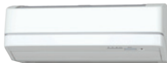
室内ユニット(壁掛けタイプなど)

本キャンペーンの対象機器は、協賛メーカーの 寒冷地向けあったかエアコン ※に限ります。