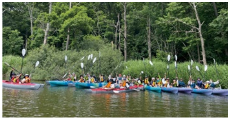
国定公園内網走湖の自然とカヤック体験