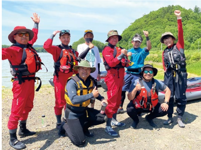
ガイド講習会により育成されたガイドメンバー