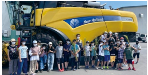
市内小学校総合学習 コンバイン見学