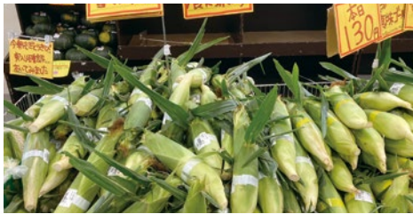
今朝もぎトウモロコシ