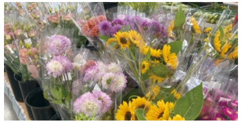
花のまち えにわの切り花