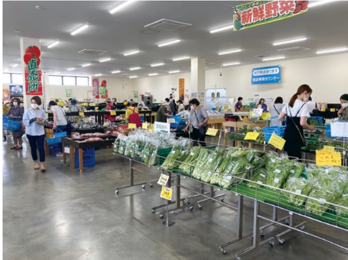
農畜産直売所「かのな」店内