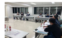
合意形成・計画づくり

住民意向調査、地域住民によるワークショップ開催 資源活用の推進体制・組織の整備、実施計画づくり 等