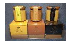
地域産品の加工・商品化

地場農林水産物を使った地域産品づくり 既存の直売所等と連携した販売促進、地域ブランドづくり 商品パッケージ等のデザイン検討、ECサイトの立ち上げ 等