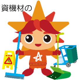
マスコットキャラクター アビリス