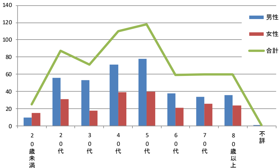
図. 性別・年代別自殺者数.