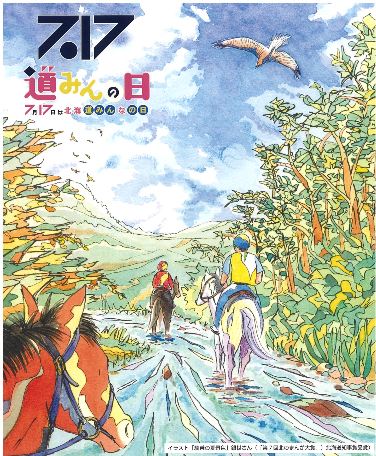
イラスト「騎乗の夏景色」銀世さん（「第7回北のまんが大賞」）北海道知事賞受賞

アンケートにご協力をお願いいたします。アンケートにご協力いただいた先着500名の方に記念品を進呈いたします。