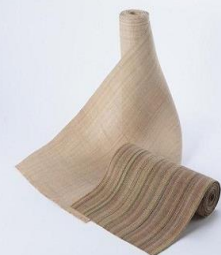
二風谷アットゥシ

産地(平取町)でしか通常購入できない製品を 数多く取り揃えておりますので、ぜひお立ち寄りください