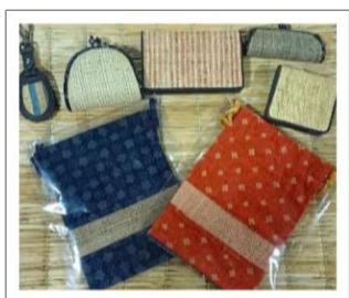
二風谷アットゥシの小物類