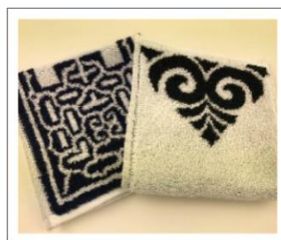
今治タオルとのコラボ商品