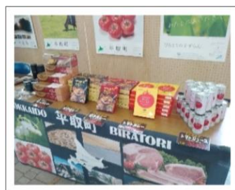
トマトジュースやカレーなど 平取町特産品