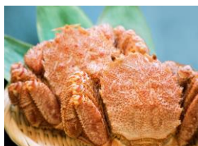
枝幸産毛ガニ(瀧源商店)