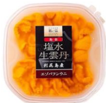
膳の一品エゾバフンウニ(膳)