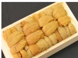
生エゾムラサキウニ(うろこ市)