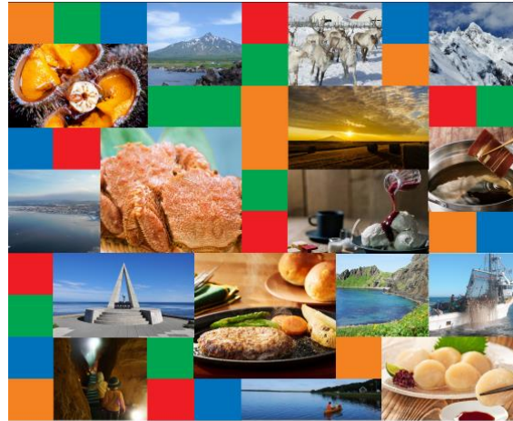
宗谷の魅力あふれる3days!!

～ そうや 宗谷の魅力あふれる 3days!!～ 「北海道 宗谷 グルメフェア in 羽田空港」～