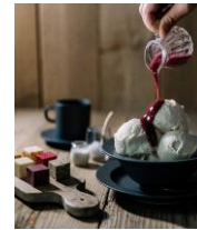
とよとみバタージェラート(川島旅館)