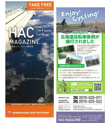
北海道エアシステム機内誌