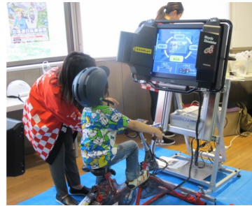
自転車シミュレーター