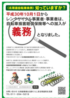
保険加入義務化チラシ