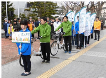
サイクルパーティーキャンペーン開始式