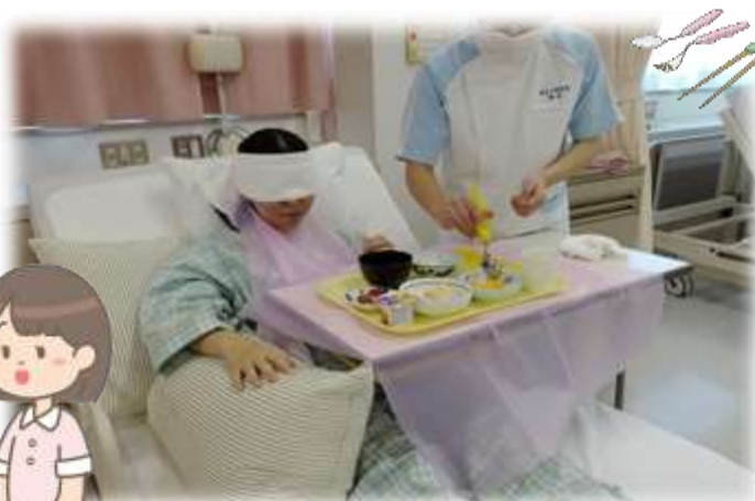
▲1年生・食事援助の演習