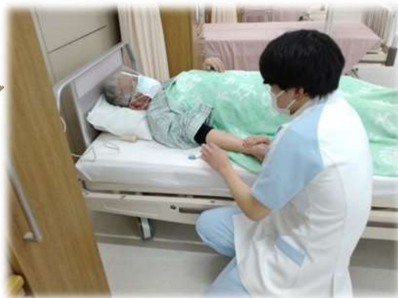
▲1年生・バイタルサイン測定（地域住民の方が模擬患者さんとして参加）