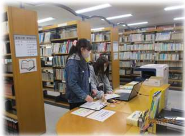
▲新入生の学院案内