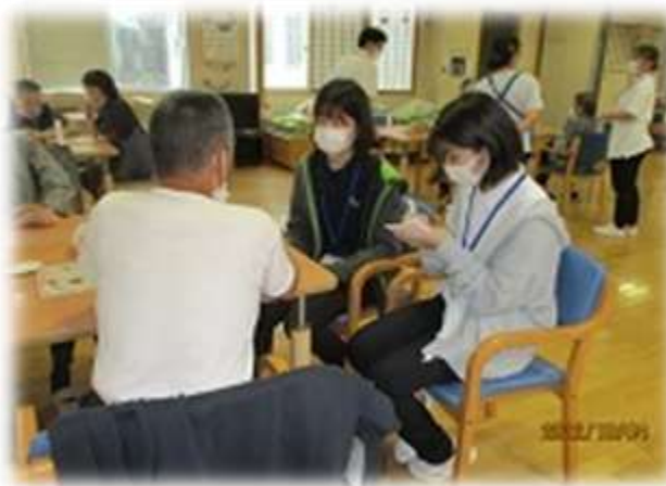
▲1年生 人と生活を知る実習（ディサ・ビスセンター）