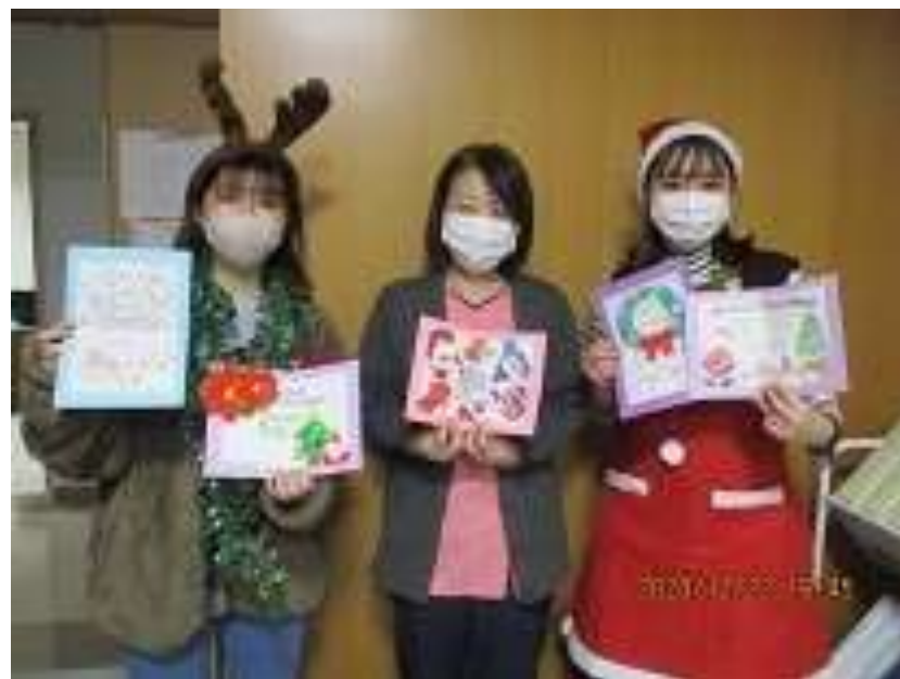
▲江差病院との交流（R4は手書きのクリスマスカードを作成しお届けしました）