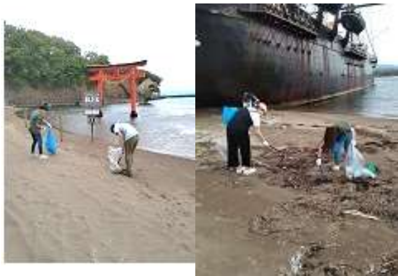
かもめ島海浜清掃