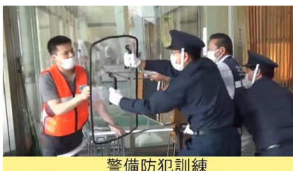
&lt;8/8 道の警備防犯訓練&gt;