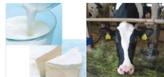
<5/13 Twitter で道民の皆様へ報告・お礼>

豊富な栄養素が含まれる牛乳・乳製品。 これからも生活の中に取り入れていただくようお願ひします。