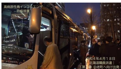
&lt;4/18 鳥インフルエンザ対応&gt;