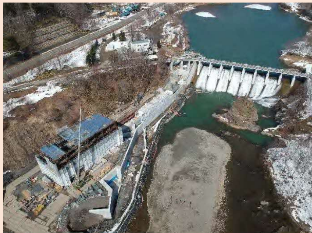
清水沢発電所改修工事（工事現場全景）