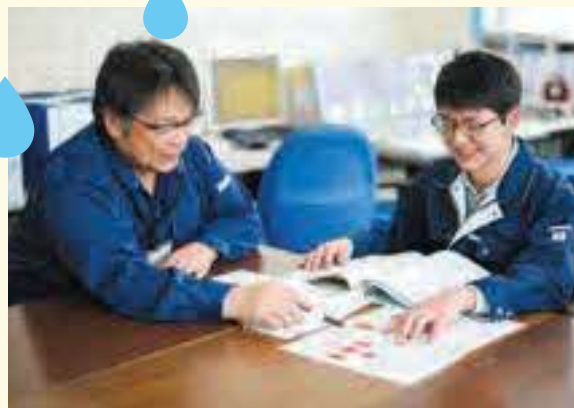
職場は風通しが良く、和やかな雰囲気。

当局の運営しているダムは、一般企業に工業用水を送ったり、発電のために水を貯めたりする「利水ダム」。とはいえ、台風や大雨の際には上流の雨量計や流量からダムに流れ込む水の量