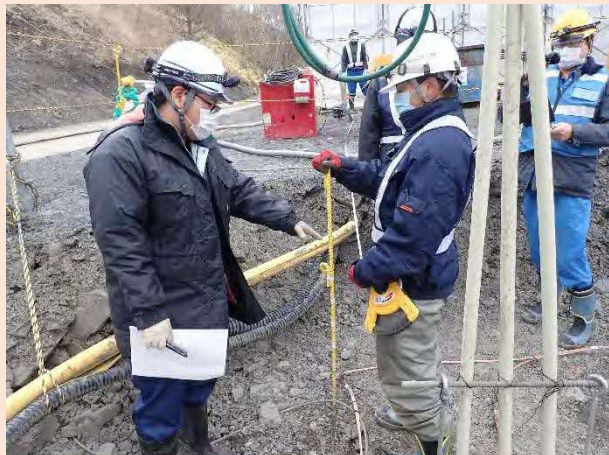
清水沢発電所改修工事（工事監督状況）