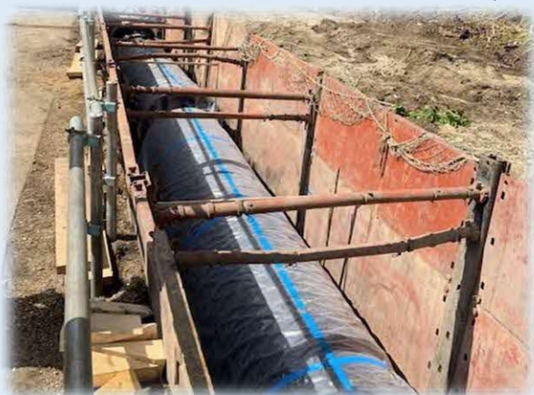
工業用水道管布設工事 （管設置状況）