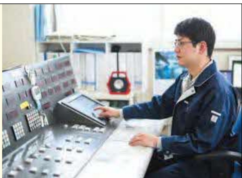
ダムを管理するための専用機械を操作。