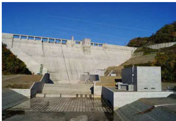
スーパーパロ発電所と夕張スーパーパロダム

企業局は、北海道が経営する地方公営企業で、 再生可能エネルギーである水力を利用して発電する電気事業と、 鉄鋼や自動車関連企業等の工場に工業用水を供給する工業用水道事業を行っています。