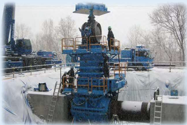
工業用水道管布設工事 （不断水仕切弁設置状況）

これらの施設の建設・改修及び維持管理を通じて、北海道の産業や経済の発展とともに、道民の暮らしが、より豊かとなるよう、日々の業務に取り組んでいます。