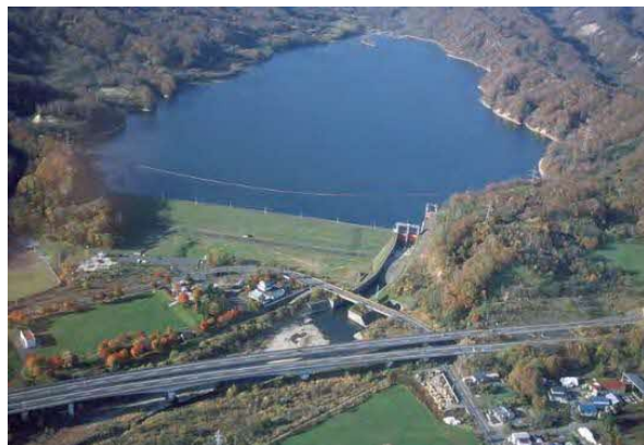
室蘭地区工業用水道（幌別ダム）

知事部局と同時に、大学、高等専門学校、高校、専門学校の卒業予定者、 または卒業生などを対象に、土木職の技術職員を募集しています。