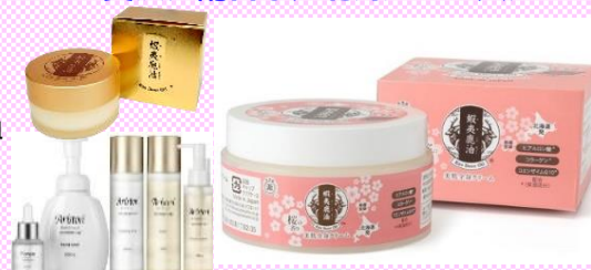
蝦夷鹿油全身美肌クリーム (株)和楊徳信 (札幌市)