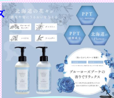
GRACE NORD PREMIUM (ガラスノールプレミアム) (株)活里 (札幌市)

北海道産ブルーローズ とPPT配合 サロンでも評判の 【美容液シャンプー & トリートメント】