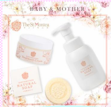
天然馬油保湿クリーム (株)The St Monica (セントモニカ) (札幌市)

自社製造の化粧品原料「キトサンエキス」 を配合した肌にやさしいスキンケアブランド