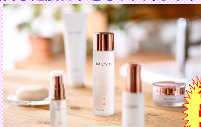
モイスターローション 北海道曹達(株) (苫小牧市)

自社製造の化粧品原料「キトサンエキス」 を配合した肌にやさしいスキンケアブランド