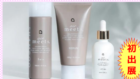
エアミーツ リフトゲル 高濃度美容液 (株)イン・フィリート (富良野市)

北海道産ブルーローズ とPPT配合 サロンでも評判の 【美容液シャンプー & トリートメント】