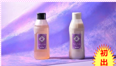
Haskap Beauty (株)アメージングアंक (札幌市)