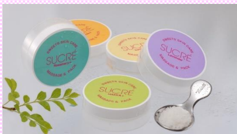
スイーツ スキンケア シュクレ (株)アビサル・ジャパン (札幌市)