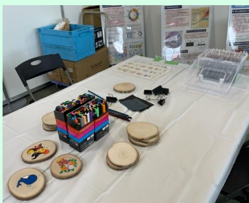
▲コースターお絵かき

●多くの方に CO 2 吸収源の森林をもっと身近なものとして感じていただけるようにイベントを実施しました。