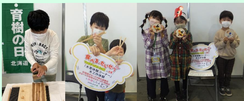
▲楽しみながら森林や木製品を体感いただきました