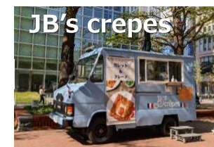
フランス人がつくる本場フランスの ガレットとクレープ