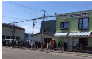
行列のできる人気店「おかめや」