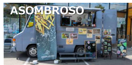
道産ジャガイモのハンドカットフライズ ・スムージー