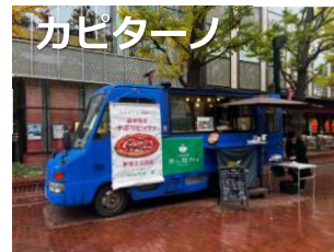
北海道産小麦の生地を新窯で焼き上げる 本格ナポリピッツァとドリンク