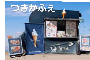
浜中町産の厳選牛乳を使用した ソフトクリーム・パフェ