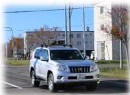
広報訓練 （広報車による広報）