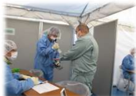
原子力災害医療活動訓練 （避難退域時検査）