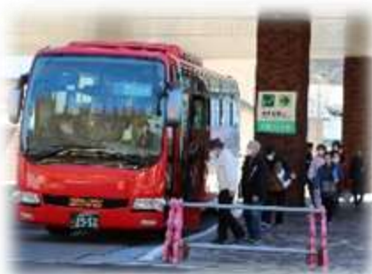
住民避難等訓練 （バスによる避難）