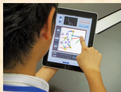
▲ iPad miniでの使用風景