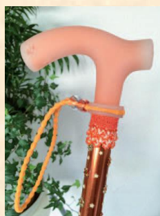
▲鮮やかな発色と人目を引くデザイン