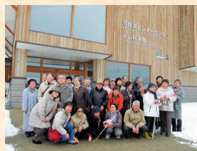
▲視覚障がい者社会参加支援