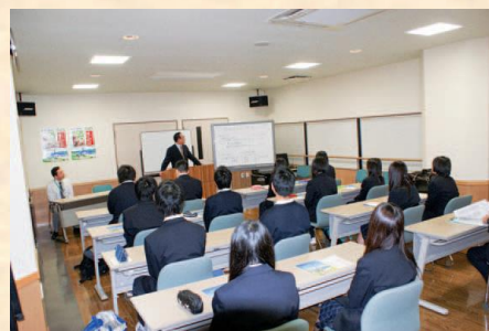
▲学校等での講演、車いす体験、会社見学などを積極的に実施