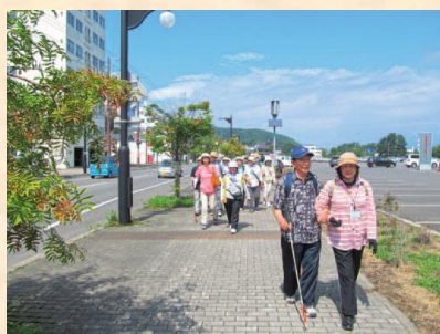
▲相互実践研修会の様子

制度ではなくボランティア活動として、長期間にわたって取り組んでいる実績が評価された。