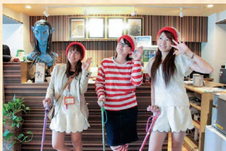
▲明るい杖で気持ちも明るく！

杖のマイナスイメージを払拭するだけでなく使用者の気持ちも明るくするという着眼点、自分だけの杖を作ることができる独創性及びコミュニケーションツールとしての可能性が評価された。