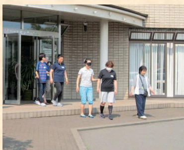
▲市民へのボランティア体験講座