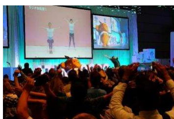
オープニング①（ラジオ体操）