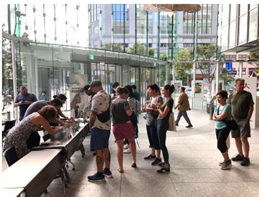
この日以降のチェックイン

PSAに参加しない人のほとんどはこの日に北海道に到着し、大会用のバッジを受け取りに来場した。 PSAを終えた参加者も日本・全道各地から続々と札幌に集まった。