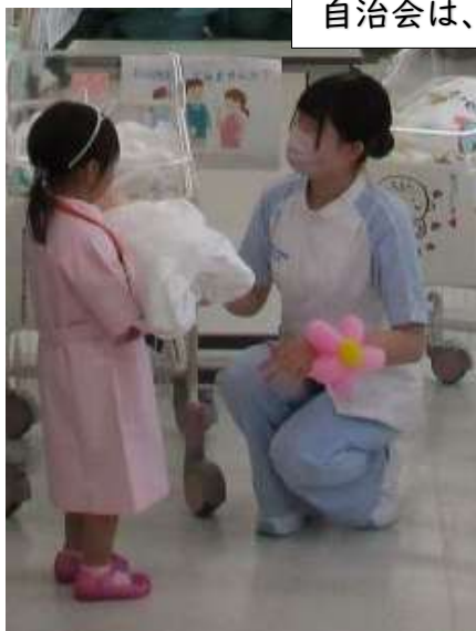
▲看護体験コーナー

R5年度は、地域の誰もが参加できるイベントとして開催。 自治会は、看護体験やミニ縁日を担当し、大勢の方に喜んでいただきました。