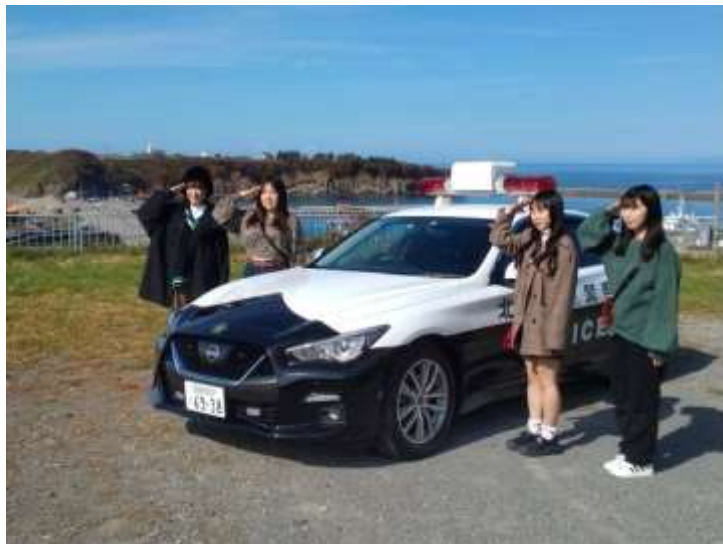
町内警戒活動に同行