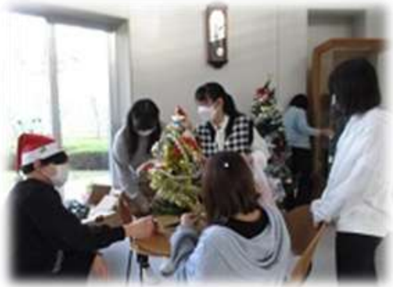
▲学院ホールの飾り付け（クリスマス）