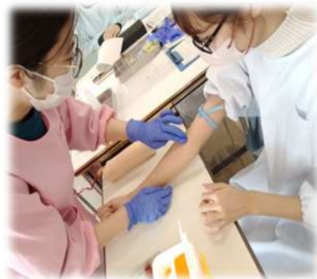
▲2年生・採血の演習