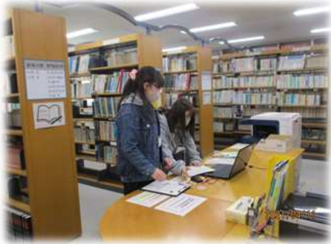
▲新入生の学院案内