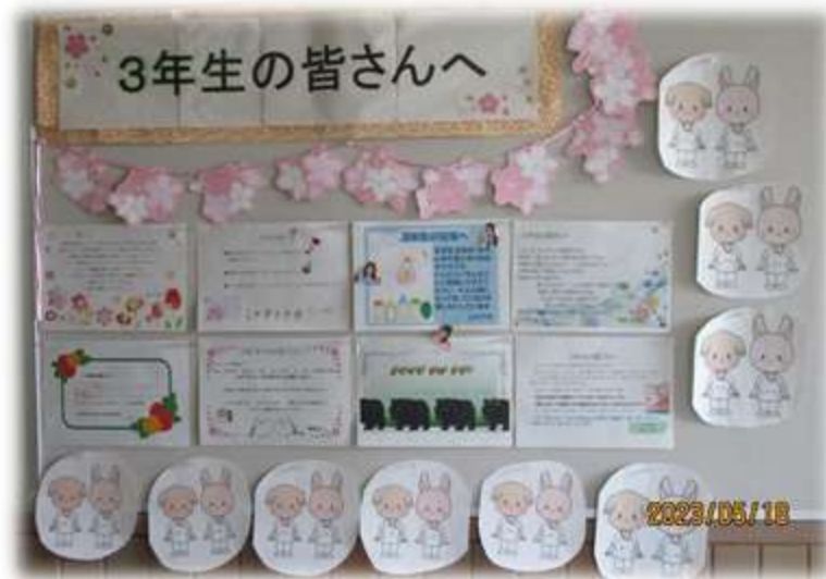
▲3年生・実習前の教員からの応援メッセージ