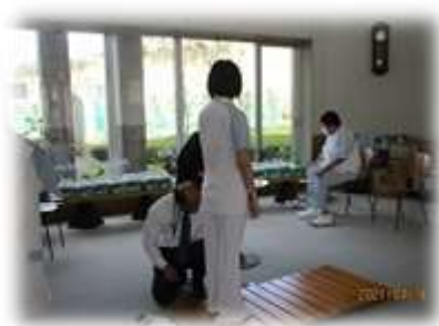
▲1年生 ユニフォーム合わせ