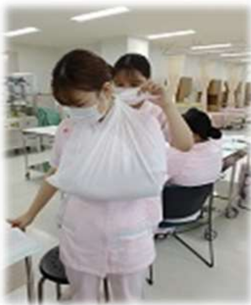
▲2年生・看護方法論演習（包帯と三角巾）