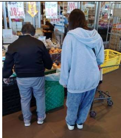
江差高校生と一緒に、スーパーでお買い物をする高齢者のお手伝い