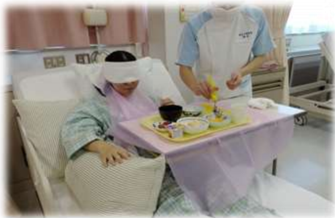
▲1年生・食事援助の演習