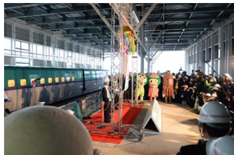
試験走行歓迎セレモニー(H26.12新函館北斗駅)