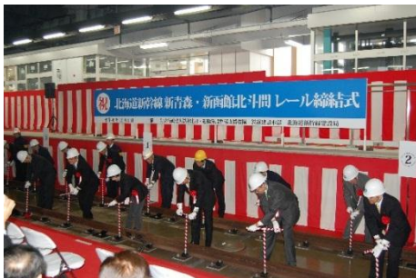
レール締結式(H26.11木古内駅)