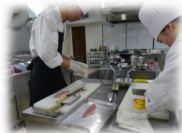
移住者子弟研修事業(調理技術)