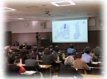
北方圏講座(道立女性プラザとの共催)