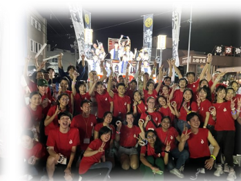
留学生地域交流事業