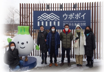
南米ふるさと訪問団受入事業