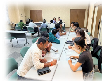
外国人相談センター移動相談会