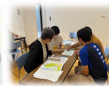
日本語学習支援者養成研修