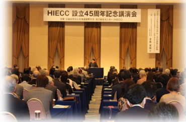
国際理解講演会(設立45周年記念)