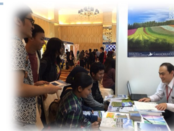
外国人留学生受入プロモーション