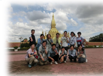
高校生世界の架け橋養成事業