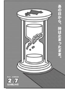
2022年度 最優秀賞(総合)

http://www.pref.hokkaido.lg.jp/sm/hrt/index.htm