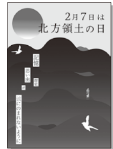
2022年度 優秀賞(大学・専門学校の部)

北海道デザイン協議会は、個人、産業、地域、社会、そしてよりグローバルな領域におけるデザイン活動の向上と活性化をめざし、北海道のデザインの可能性を信ずる人々の力を結集し、多様なデザイン活動を通じて社会への提案と啓蒙活動を展開する団体です。 詳しくは、ホームページをご覧ください。 http://www.hda21.jp/