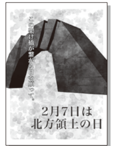
2022年度 優秀賞(高校の部)