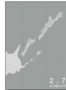
2022年度 優秀賞(一般の部)