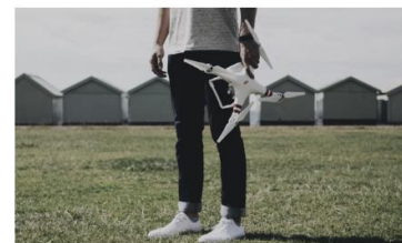
賠償責任保険・機体保険<加入済み>

2種類の保険が最初から標準で付属しています。対人1億・対物1億の賠償責任保険と機体保険を全ての機体に加入しています。 ※破損時は運用停止に伴う休業補償はお客様負担となりますので予めご了承ください。