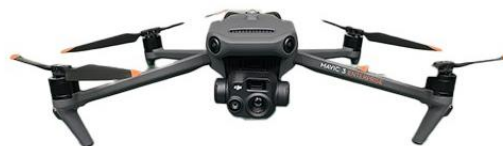
DJI Mavic 3 Thermal