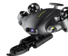
QYSEA FIFISH V6 Expert