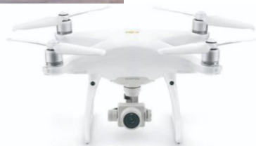
Phantom 4 PRO V2.0