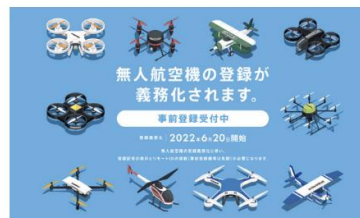
ドローン登録制度<登録済み>

全ての製品は全て国土交通省のドローン登録制度に登録済みです。全ての機体に登録番号が割り当てられているため、安心してご利用いただくことができます。