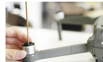
機体整備点検<メンテナンス済み>

認定整備士がレンタル利用前、利用後の2回メンテナンスをおこなっているため整備済みの機材を提供いたします。