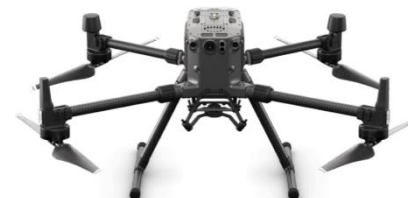
Matrice 300 RTK