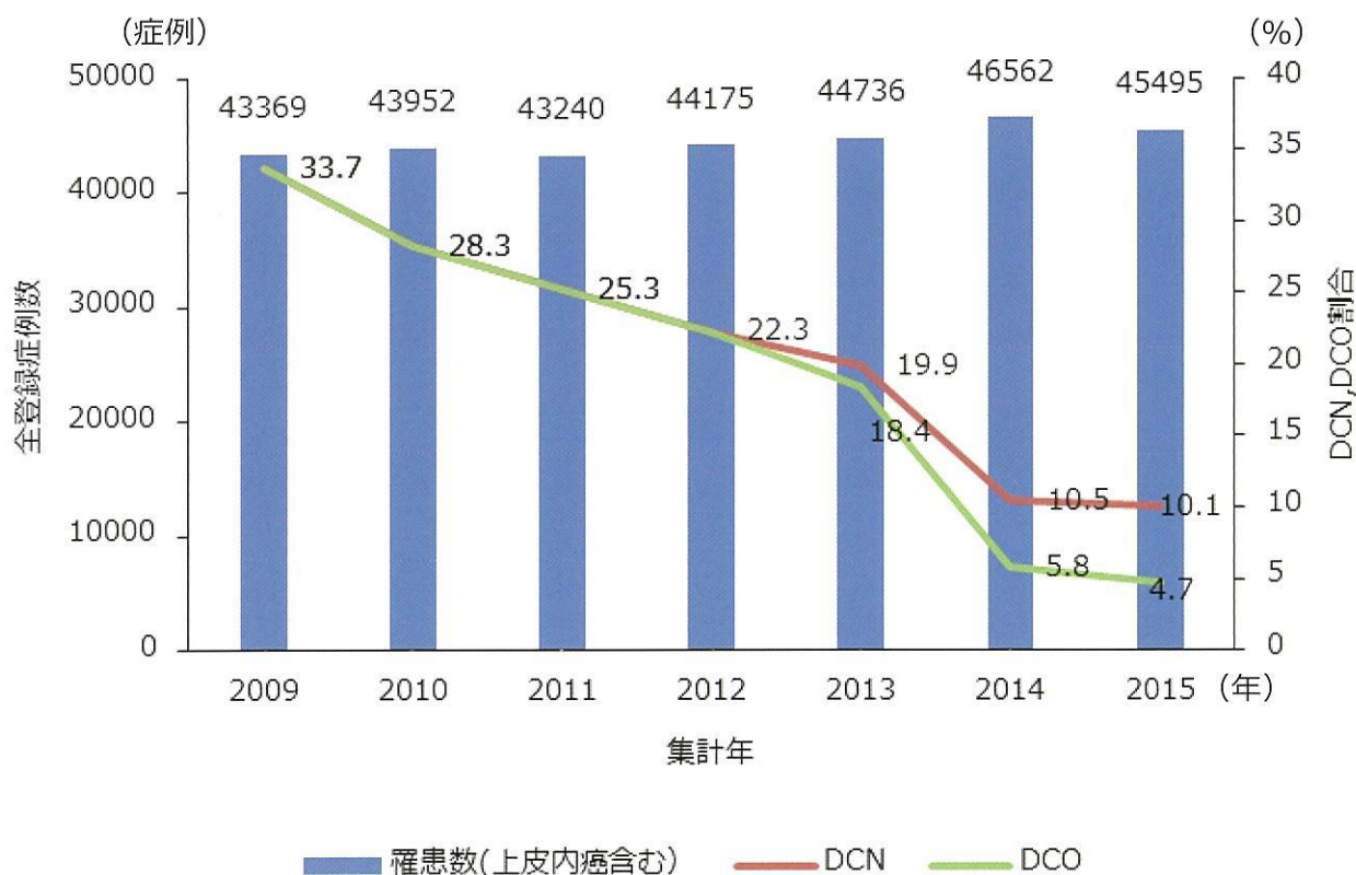
図 2. 北海道がん登録の届出数および DCN、DCO 割合の推移