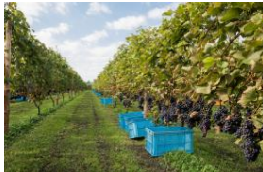
町内で栽培されるぶどう畑