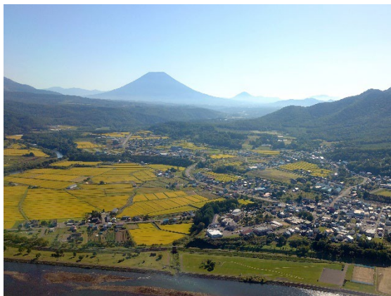
蘭越町の田園風景と羊蹄山