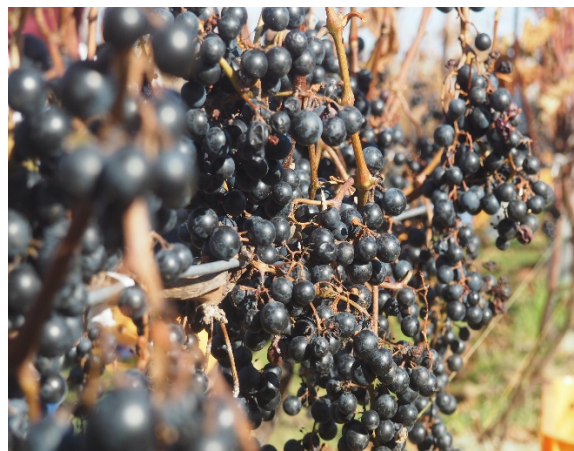
鶴居村の豊かな自然で育った山幸