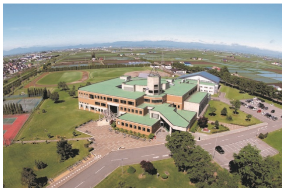
体験製造場開設予定の拓殖大学北海道短期大学キャンパス