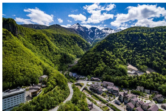
上川町の「層雲峡」の全景