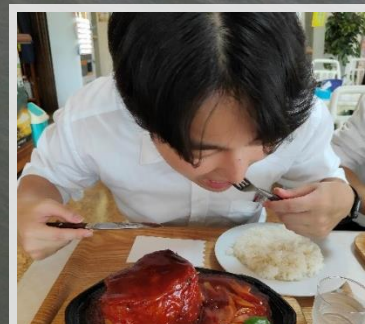
「ポークチャップのお店 ロマン」 ポークチャップ（別海町）