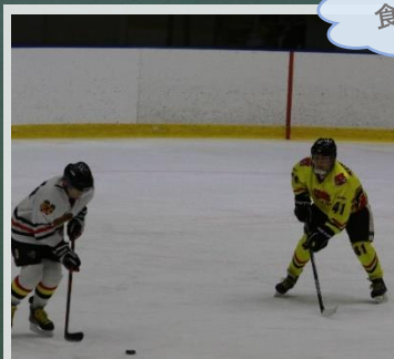
週末はアイスホッケー！ 黄色いユニフォームが中野技師

当該漁港では係留施設の新設により、これまで自然浜で陸揚げを行っていた漁船の漁港内利用が可能となります。 →静穏が確保された漁港内を利用することで漁業者の安全確保、船体損傷の抑制などにより、漁業の振興を図ります。