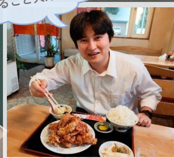
「中華の店 龍鳳」 からあげ定食（中標津町）