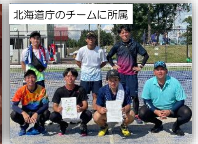
北海道庁のチームに所属