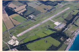
地方空港の機能向上