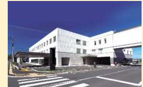
地域のための医療施設の整備