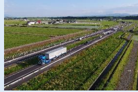
安全で快適な旅ができる 交通ネットワークの整備