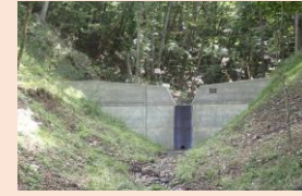
治山ダムや保安林の整備