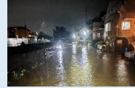
治水・砂防・海岸や避難施設 などの整備