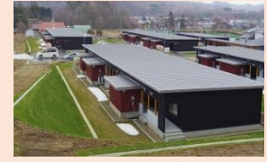
バリアフリーに対応した 公営住宅や公園の整備