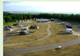
良好な水辺環境や緑地などの整備