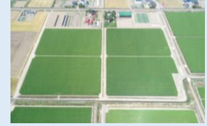
農地や農業用施設の整備