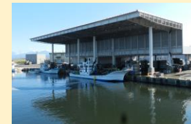
荷さばき施設など水産施設の整備