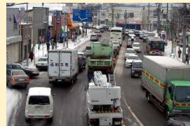
バイパスなど都市内の道路の整備