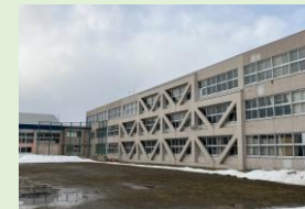
私立学校の改築の支援