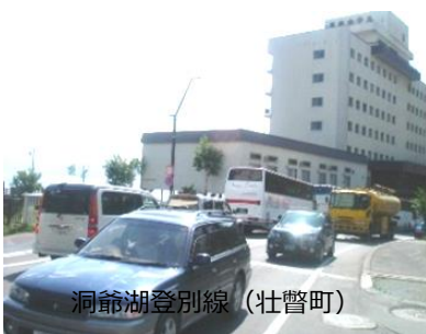
洞爺湖登別線（壮瞥町）