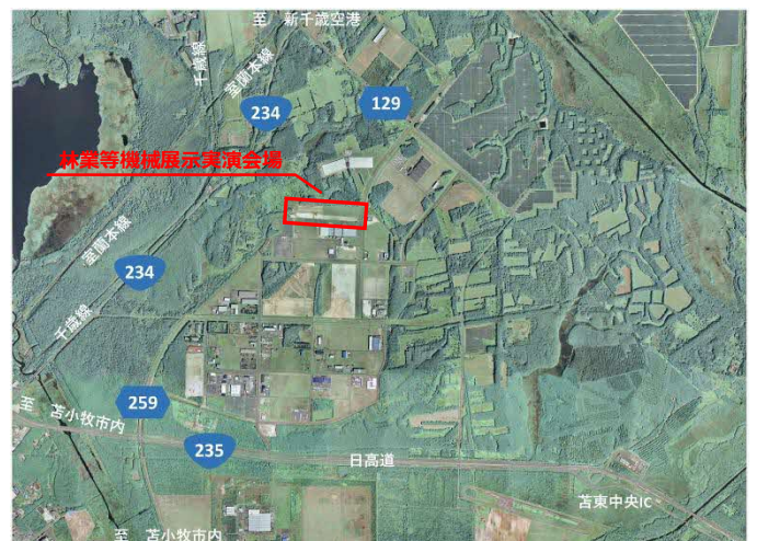
森林・林業・環境機械展示実演会 位置図-2