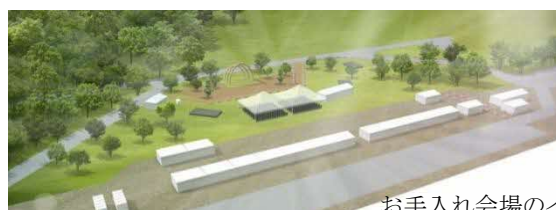
お手入れ会場のイメージ