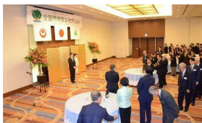
沖縄県[令和元年]での様子