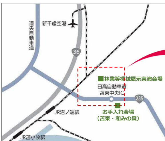
森林・林業・環境機械展示実演会 位置図-1