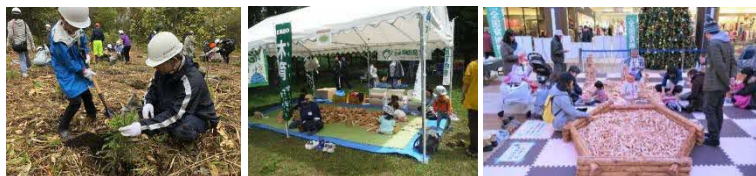
圏域木育フェスタの様子