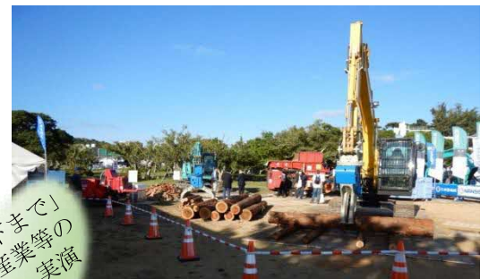
沖縄県[令和元年]での様子