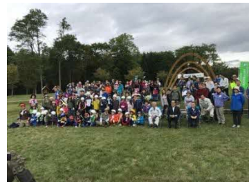
苫東・和みの森 イベント開催時の様子[平成29年]