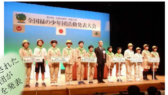
沖縄県[令和元年]での様子