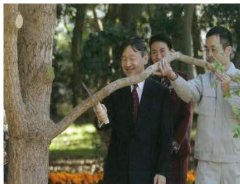
東京都[平成30年]での様子