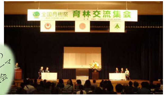
沖縄県[令和元年]での様子