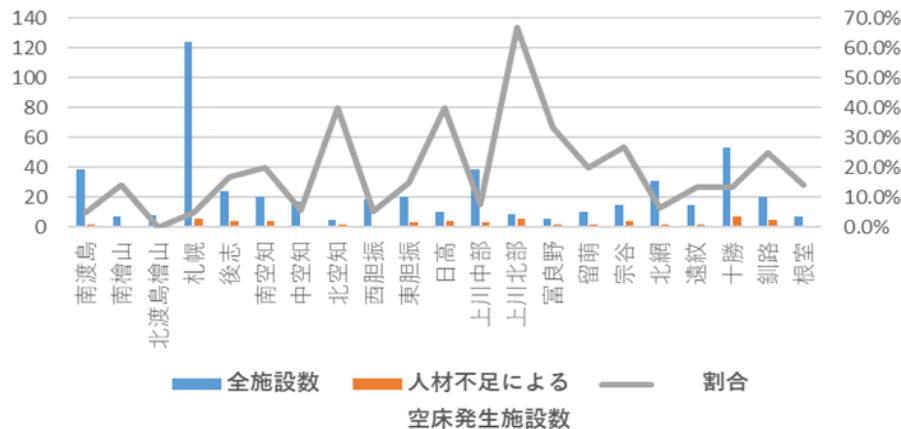
介護職員不足による空床が発生している特別養護老人ホーム