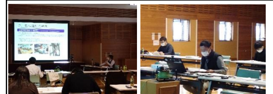
農福連携セミナー