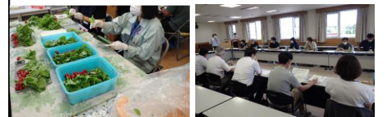
現地見学会・意見交換会