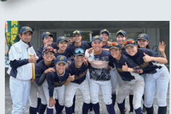
「ホーネット・レディーズ」の選手たち