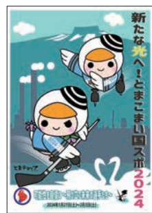
氷上のアスリートたちを応援しよう

2024年1月27日(土)~2月3日(土)、苫小牧市で「第78回国民スポーツ大会冬季大会スケート競技会・アイスホッケー競技会」が開催されます。北海道選手団をはじめ全国から集まる選手たちの活躍にぜひご注目ください。