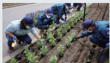
育てた花苗を道の駅の花壇に植栽