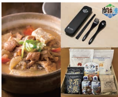
炭鉄港めしを食べた炭鉄港地域の特産品を当てよう

空知管内10市町・小樽・室蘭・安平で、日本遺産「炭鉄港」の食文化である「炭鉄港めし」を楽しみながら地域を周遊してもらうスタンプラリーを開催中です(2024年2月18日(日)まで)。LINEアプリを使ってスタンプを集めると炭鉄港カトラリーセットや炭鉄港地域の特産品が抽選で当たります。