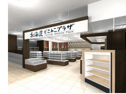
JR札幌駅西通り北口にある札幌店は2月1日リニューアルオープン