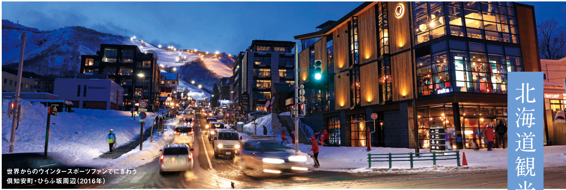
世界からのウインタースポーツファンにきわむ 倶知安町・ひらふ坂周辺(2016年)