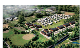
環境配慮型街区の完成イメージ

ニセコ町は国の「SDGs未来都市」に選ばれ、町では温室効果ガスの排出量を2050年までに実質ゼロにする目標を掲げています。現在進められている第2次ニセコ町環境モデル都市アクションプランでは、2019年からの5年間で、温室効果ガスの削減に取り組むだけでなく、地域課題を解決し、より良い暮らしを形づくることを目指しています。