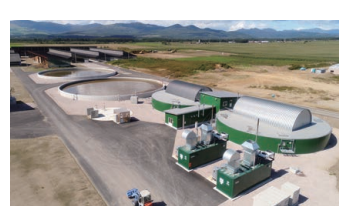
有限会社ドリームヒルのバイオガスプラント

酪農・畜産の盛んな上士幌町は、人口約5,000人に対して4万頭以上の牛が飼養される地域。産業の拡大に伴う増頭・増産により、家畜ふん尿の適正処理は近年の地域課題となっていました。