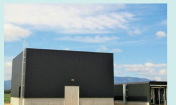
ホワイトデータセンター

町や農協など6団体が連携し、畜産バイオマスによるモデル地域の構築を進めてきました。この事業では、家畜ふん尿を発酵させてバイオガス発電を行うだけでなく、発酵後の消化液を固体と液体に分け、固体は牛の糞わりとして、液体はデントコーン畑などに液肥として再利用しています。また、連携先の有限会社ドリームヒルでは、余剰バイオガスを熱源にして、イチゴやブドウなどのビニールハウス施設園芸に取り組みジェネレーターやケータキに利用し販売しています。