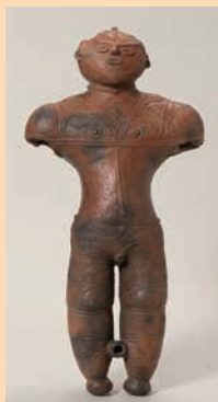
中空土偶(国宝)函館市 縄文文化交流センター蔵

縄文文化は、自然と人間が共生し、1万年以上もの長い年月にわたって営まれた世界的にも極めてまれな先史文化です。その歴史を一つの自然環境のもとで語るることができる貴重な文化遺産が、17遺跡からなる「北海道・北東北の縄文遺跡群」です。この遺跡群を未来へ引き継ぐため、4道県および関係市町では、連携・協力して世界遺産登録を目指し、取り組みを進めています。2020年1月、政府よりユネスコ国連教育科学文化機関(ユネスコ)に推薦書が提出され、現在はユネスコの諮問機関であるイコモス(国際記念物遺跡会議)の審査が行われています。道では引き続き、関係機関と連携し、北海道初の世界文化遺産登録の実現に向けて取り組んでいきます。さらに、こうした取り組みを通じて「北海道の縄文」の価値に光を当て、地域に交流とにぎわいを創り出していくことを目指しています。