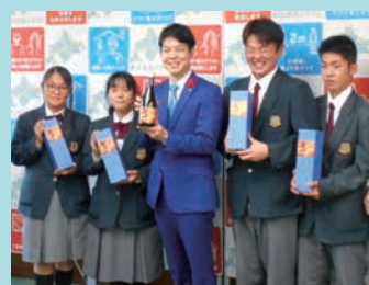
「忠」をPRする倶知安農業高校の生徒たち(2020年10月13日)

倶知安農業高校では、地域の産業振興の一環として、地元の酒蔵「二世古酒造」と連携し、2019年から日本酒製造プロジェクトを進めています。高校の水田で酒米を栽培し、二世古酒造の社員の指導のもと、洗米から仕込み、びん詰め、ラベル貼りまで高校生が行い、2020年9月、待望の商品化が実現しました。ネーミングやラベルデザインも生徒が考案したもので、商品名の「忠(なかとこ)」には、多くの人に真心を届けたいという思いが込められています。地域の産業や魅力を再発見し、将来の担い手づくりにつながる取り組みは、今後も継続の予定です。