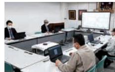
道路建設(株)のウェブ会議

への移動に費やしていたコスト・時間を大幅に削減できました。テレワークを導入して約1年。ネットワークの活用が進んだことで、全体の業務スキルが向上したと感じます。さらに社内では「日常の移動が減った分、仕事に集中しやすい」という声もあり、社員の働きやすさの向上にも寄与していると思います。