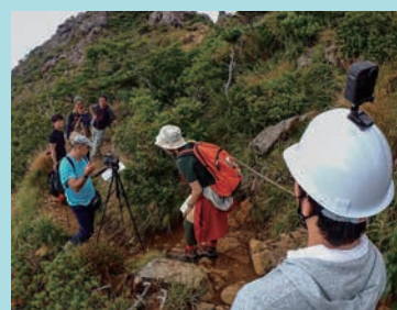
アポイ岳でのVR動画の撮影風景

道では、北海道大学とのコラボにより、道内のジオパークの魅力を感じられるVR動画「バーチャル登山!ユネスコ世界ジオパーク「アポイ岳」」を制作し、体験会などを開催しました。道の若手職員と理工系学生とで地域振興と自然科学の融合を目指す連携モデルの構築を試みたこの取り組みは、国の「地方創生☆政策アイデアコンテスト2020」地方公共団体の部において、JT B賞や北海道経済産業局長賞を受賞しました。北海道のジオパークの価値や魅力を多くの皆さんに知っていただき、地方創生に結びつけていく官学連携の取り組みを今後も進めていきます。