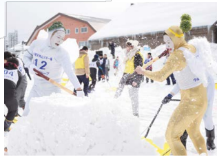
仮装して楽しむ参加者

選手権は、これまで日本スポーツ雪かき連盟が運営してきましたが、来年は小樽市と連携し、行政と市民の協働活動として行う検討を始めています。