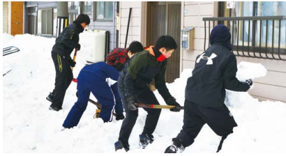
豪雪で狭くなった道を除雪する選手たち

除雪車が入れない坂道や狭い道が多い小樽では、高齢者の除雪負担が深刻化していました。つらい除雪をスポーツとして楽しもうと考案されたのが「スポーツ雪かき」。2014年から毎年2月に「国際スポーツ雪かき選手権」が開催され、地元住民や参加者からも大好評です。