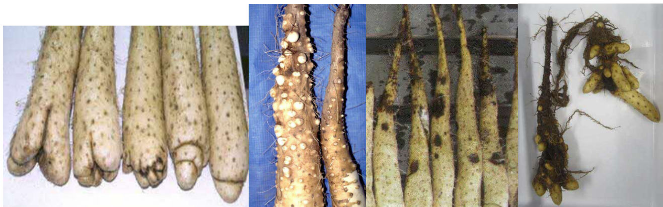
写真2 排水不良による尻部のコブ 写真3 滞水による首部の突起 写真4 根腐病 写真5 褐色腐敗病（崩壊型）

春掘りほ場では、茎葉及びネット、マルチ残さ等で畝上を被覆し、土壌凍結の軽減により腐敗防止を図る。