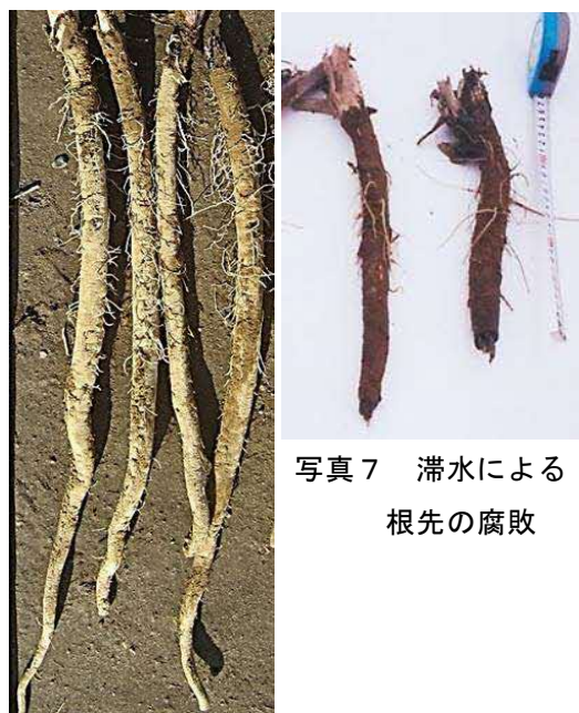
写真7 滞水による根先の腐敗

掘り取り後は、根先のしおれによる品傷みを防ぐため、コンテナに内包資材を充て品質を保持する。