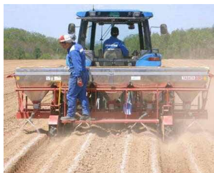
写真2 表層施肥の作業事例 (成畦の肩口に施肥)

催芽温度は、24℃で一定(20~22日間)にするか、26℃で10日間処理した後20℃まで徐々に下げる。催芽湿度は80%を目標とし、湿度計を確認しながら換気等により調節する。催芽湿度を80%とすることで期間は28~35日程度かかるが、植付後の萌芽が早まり、揃いも良く、不萌芽率が極めて低くなる(令和2年普及奨励事項)。芽の大きさや揃いを確認