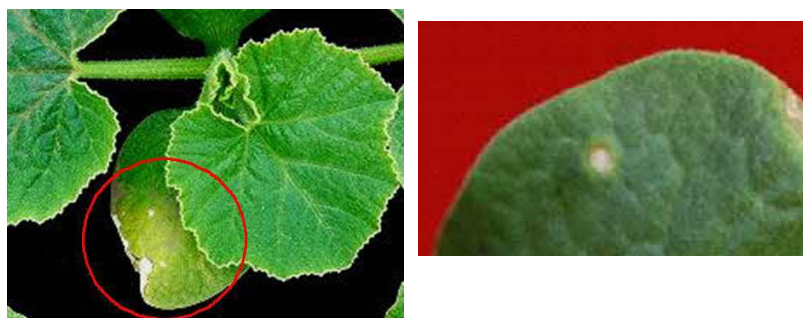
写真1 かぼちゃ苗に発生した果実斑点細菌病の病斑

発病苗をやむを得ず使用する場合は、健全苗から隔離し薬剤を茎葉散布する(「かぼちゃの突起果の発生原因解明と防除対策」平成26年指導参考事項)。