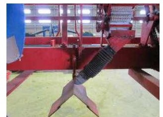
肥料が2方向に落ちる ように排出口を改造

しながら、コンテナの上下および内外の積み替えを行う。目標とする芽の大きさは、作業性を重視する場合には芽の直径が6~8mmの未分化芽とし、萌芽揃いや萌芽期の前進を重視する場合には、つるといもの区別が明瞭で、つるが1cmに伸びた状態(分化始~分化1cm)とする。催