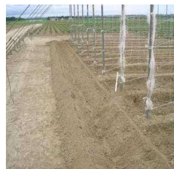
写真4 枕地の溝切り