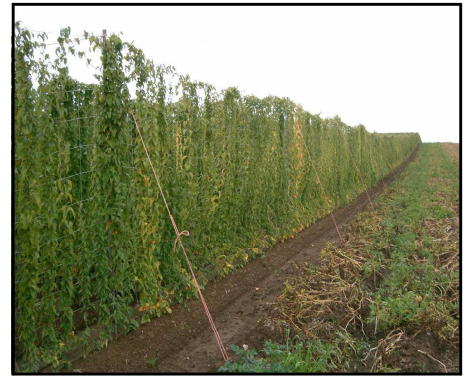
写真2 ロープによる支柱の補強

寄せ畝の2畦1ネット栽培では、つるの折損を防ぐために早めに誘引し、支柱が倒伏してもつるが切断されないよう、つるに余裕を持たせる。また、強風対策として支柱の補強を行う（写真2）。支柱栽培では、つる先が下向きになる頃までに支柱立てを終え、つるが支柱に絡まるように誘引する。