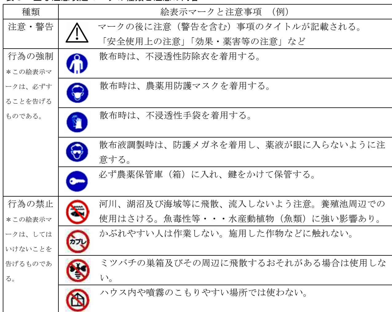
表3 主な注意喚起マークの種類と注意の内容