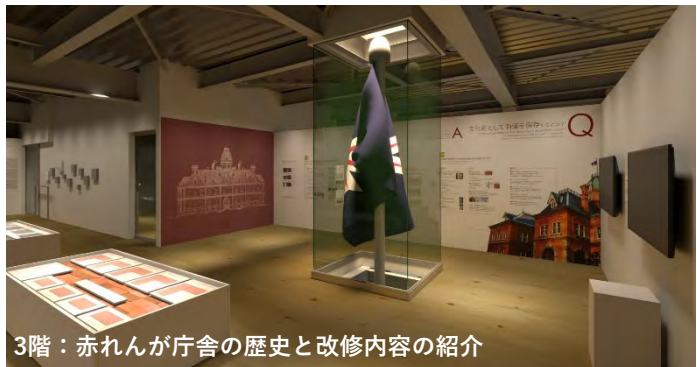
3階：赤れんが庁舎の歴史と改修内容の紹介