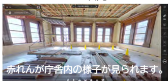
赤れんが庁舎内の様子が見られます。

スマートフォンで二次元バーコードを読み取ると、360度パノラマ画像が表示されます。