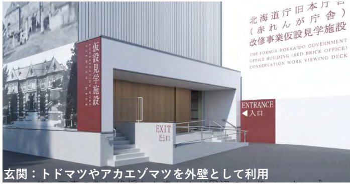
玄関：トドマツやアカエゾマツを外壁として利用