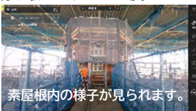
素屋根内の様子が見られます。