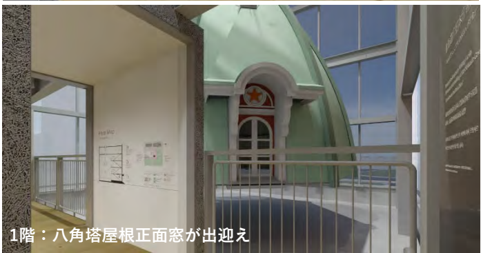
1階：八角塔屋根正面窓が出迎え