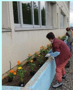
景観美化の花壇植栽