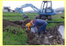
落口柵、配水管、調整板の整備