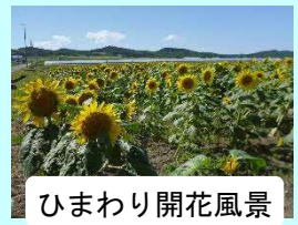
ひまわり開花風景