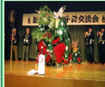
伝統芸能の鹿子舞