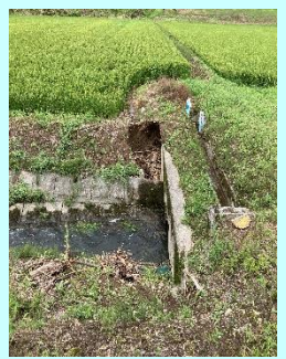
増水による法崩れ