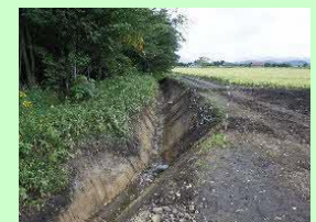
外注による水路の泥上げ