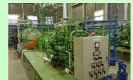
排水機場の負荷軽減