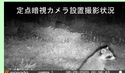
定点暗視カメラ設置撮影状況