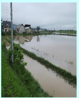
大雨後の農地状況