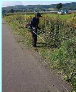
農道の草刈り 共同作業