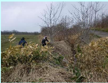
農道側溝の雑木伐採