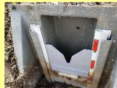
田んぼダム用堰板

降雨時は、V字部分の断面に応じて排水されるため、堰板操作が不要。(最大で10cmの雨水の貯留が可能)