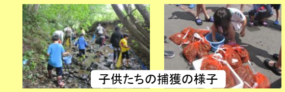
子供たちの捕獲の様子