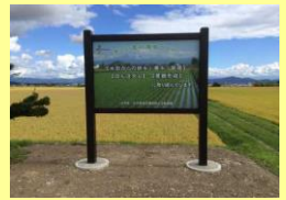
看板による田んぼダムの取組の啓発・普及